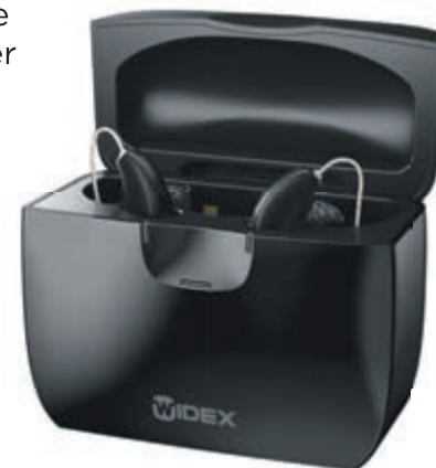
sRIC R D is het kleinste oplaadbare RIC-hoortoestel ter wereld

AANVANGSTIJDEN 14.00 UUR 16.00 UUR 19.00 UUR