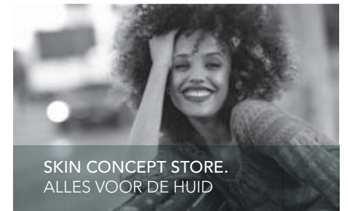
SKIN CONCEPT STORE. ALLES VOOR DE HUID

Onderhand zal het u duidelijk zijn: Instituut Périne is niet de eerste de beste. Zo wonnen we bijvoorbeeld in 2013 de prestigieuze prijs Winnares beste beautysalon van Nederland. Gun jezelf de verzorging, de diepgaande